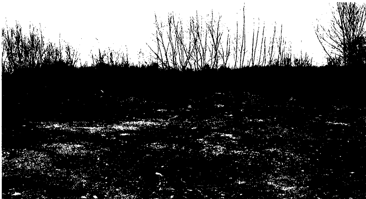
Fot. nr 1 Widok terenu rekreacyjnego w kierunku północno – wschodnim.