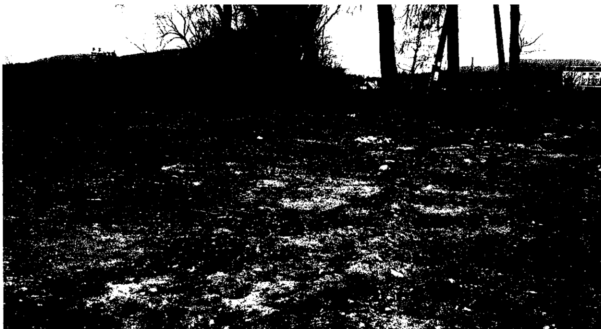
Fot. nr 2 Widok terenu rekreacyjnego w kierunku południowo - wschodnim